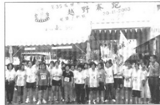
▲ 节目之一——越野赛跑。