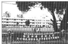
▲ 矮墙上的布条，传达了我们的喜悦。