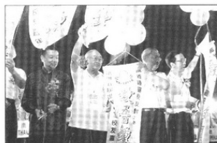
▲ 特别嘉宾升旗彩球仪式。